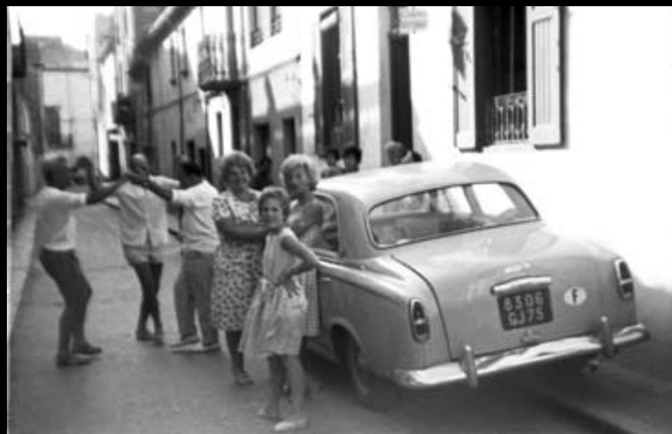
Carrer de la Tarongeta. 1961