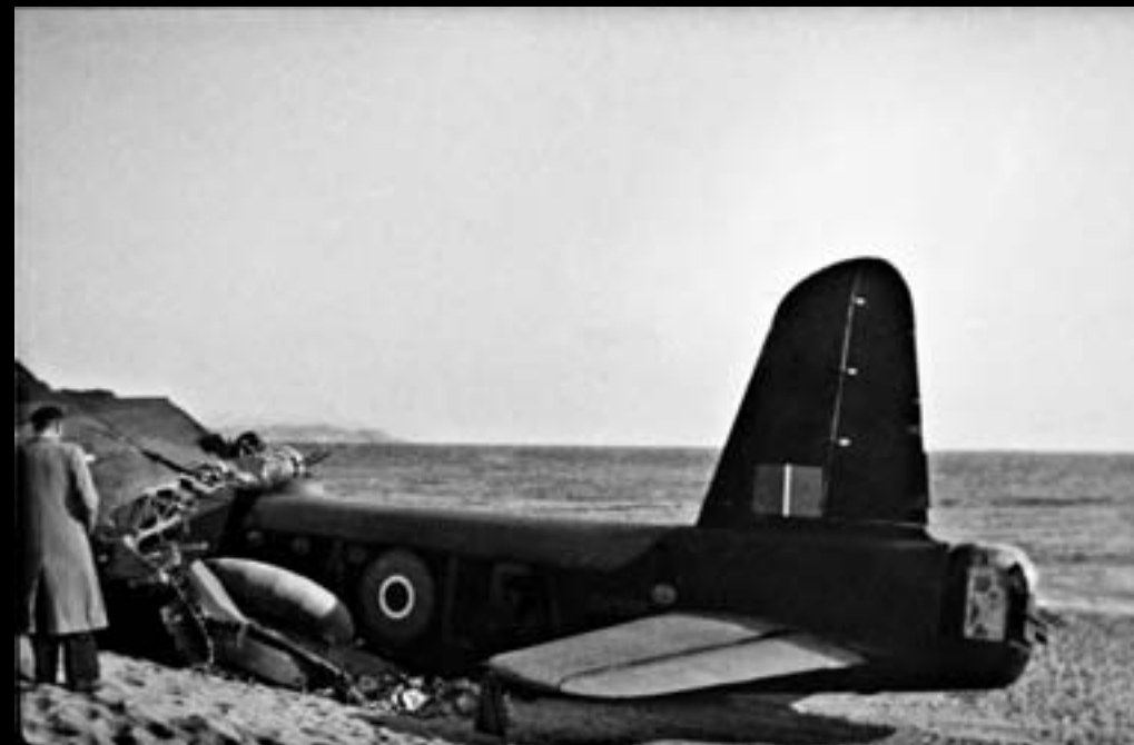
Platja d'Aro. 21 de novembre de 1942

Un Short Stirling Mk.I com el que va haver de realitzar un aterratge forçós al novembre de 1942 a Platja d'Aro. L'avió pertanyia a l'esquadró 15 i duia el numeral BK595 i les lletres LS-A sobre el fuselatge.