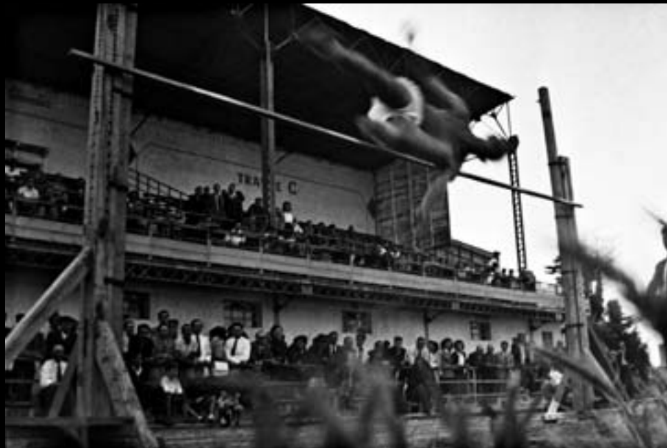
Salt d'alçada. Estadi de Perpinyà. 1948