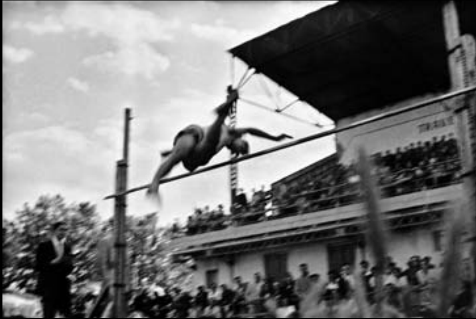
Salt d'alçada. Estadi de Perpinyà. 1948