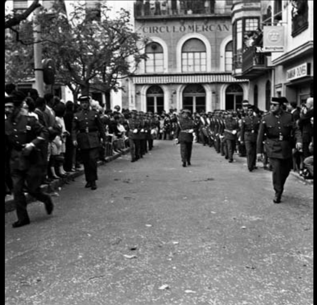
Desfilada a Plaça Nova. Festes de Primavera de Palafrugell. 1967