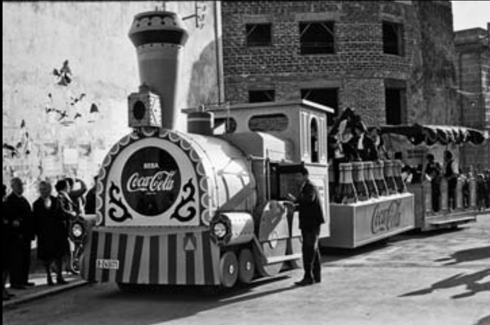
Carrossa publicitària. Festes de Primavera de Palafrugell. 1963