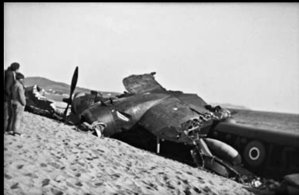
Platja d'Aro. 21 de novembre de 1942