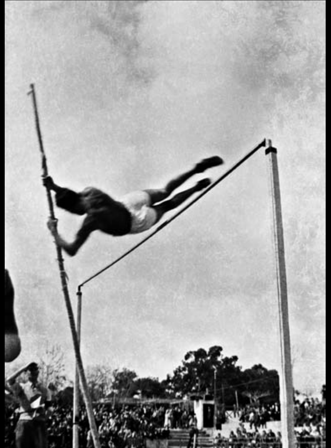
Salt de perxa. Mataró. 1946