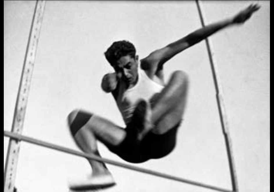
Salt d'alçada. Mataró. 1946