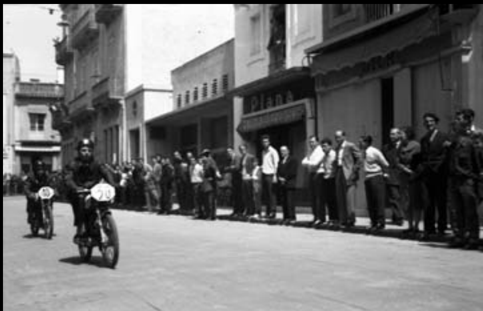
Cursa de motos per la muralla. 1961