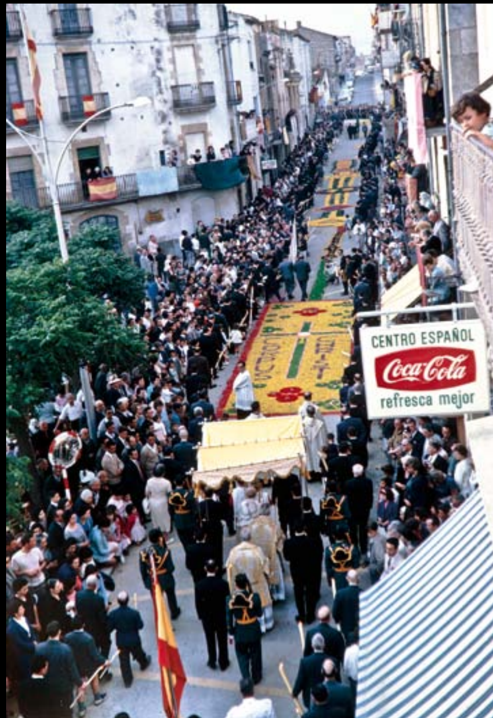
Processó de Corpus a Palafrugell. 1963