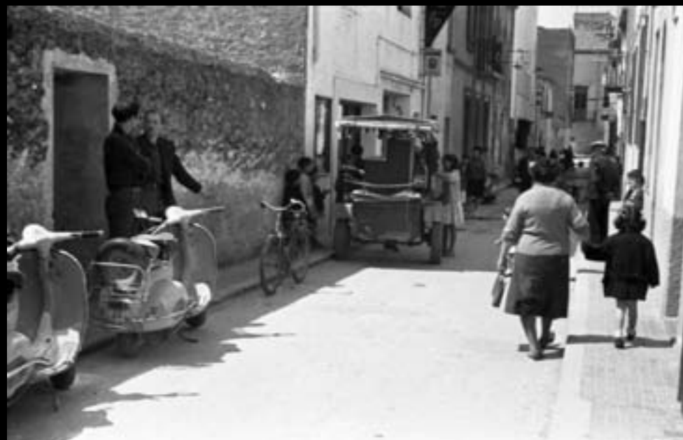
Carrer de la Tarongeta. 1964