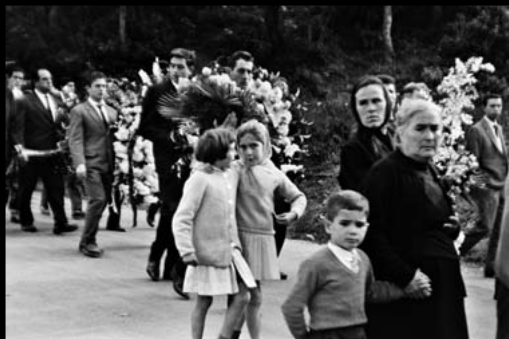
Enterrament de Carmen Amaya. Begur. 1963