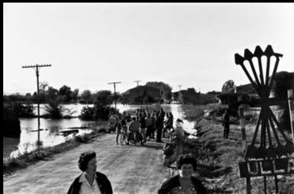
Inundacions a Ullà. 1962