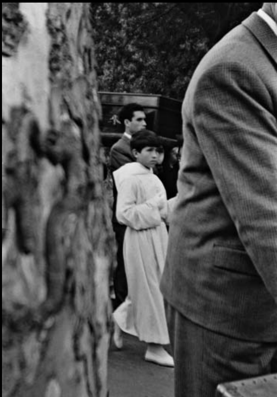
Enterrament de Carmen Amaya. Begur. 1963