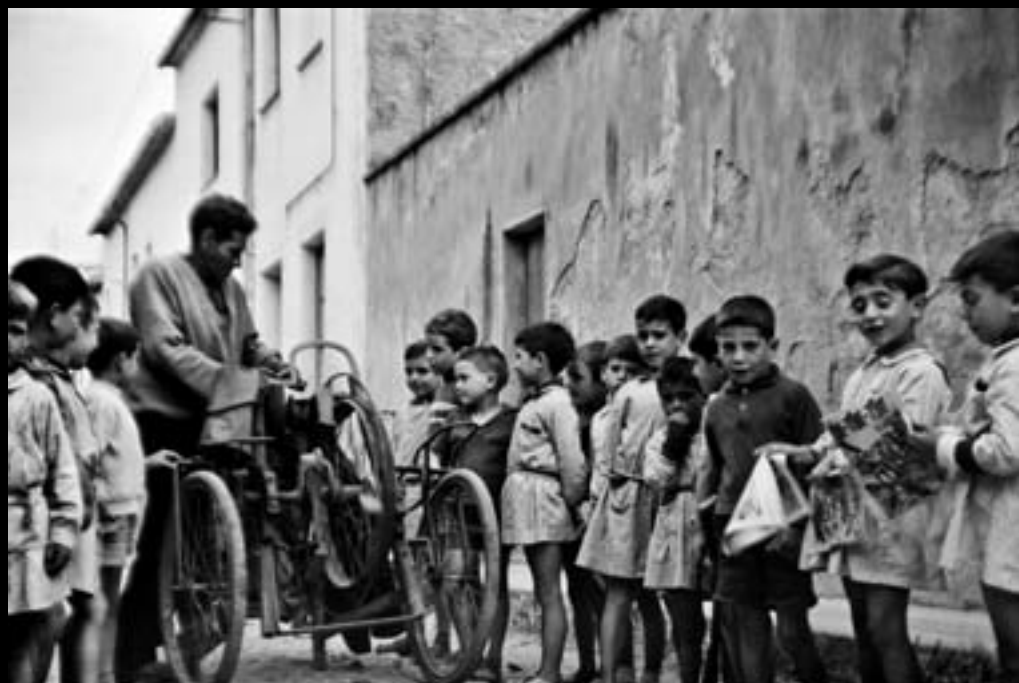
L'esmolet al carrer del Sac. Palafrugell. 1963