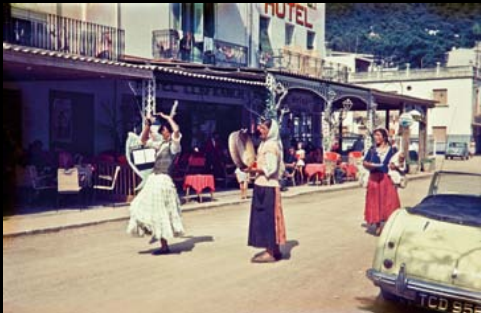
Gitanes davant l'Hotel Llafranc. Anys 60