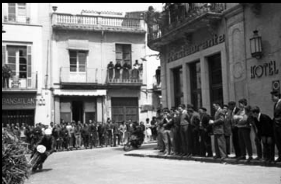
Cursa de motos per la muralla. 1961