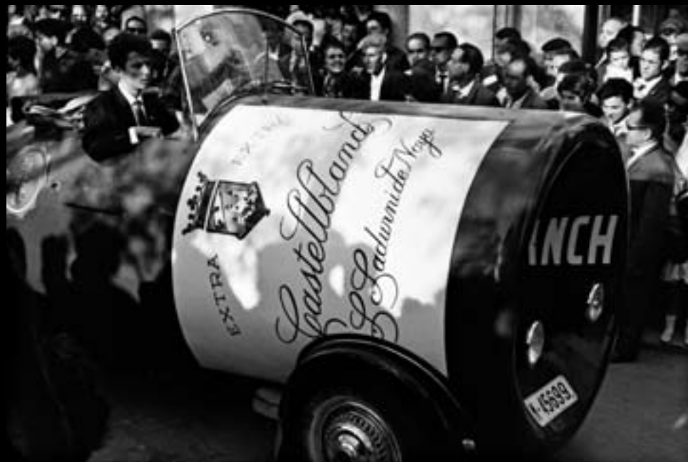
Carrossa publicitària. Festes de Primavera de Palafrugell. 1964