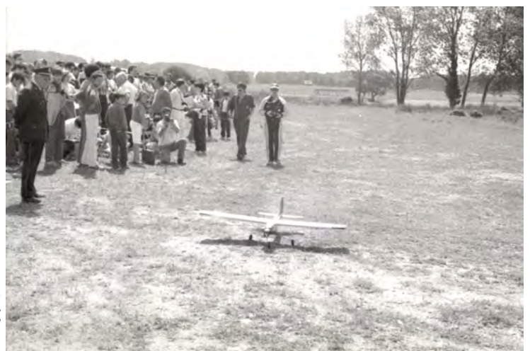
Exhibició d'aeromodelisme a l'autovia, 26 de maig de 1985.