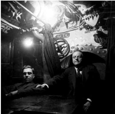
Interior d'un submarí alemany al port de Barcelona a principis del segle XX.

L'exposició en línia d'aquest any, preparada pels arxius del Baix Empordà , és 1918. La Gran Guerra des del Baix Empordà . Es presentarà a l'Arxiu Comarcal de la Bisbal el dia 8 de juny a les 19 hores. Els documents de Palafrugell que s'hi inclouen són dels fons de l'Ajuntament i de l'Hospital, de la premsa local, de la col·lecció de cartells i programes i fotografies de Josep Maimí Bonet.