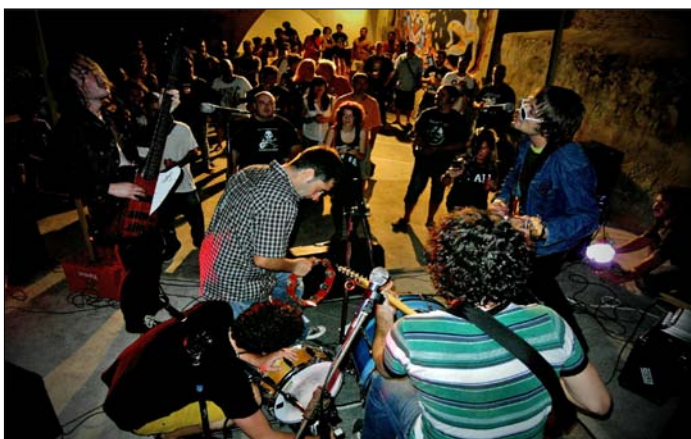
Concert al pati de Can Genís 14 de setembre