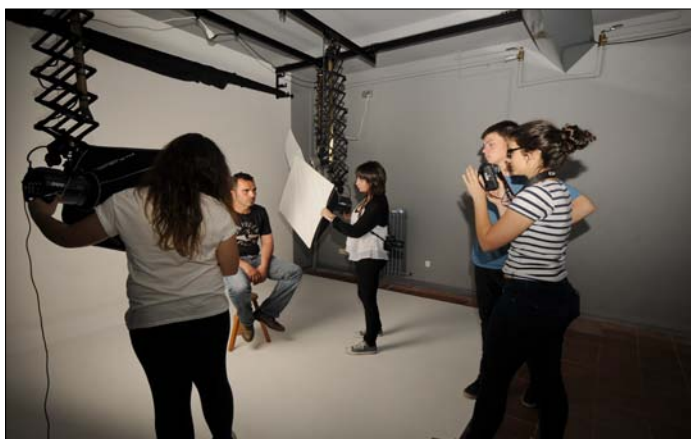
Curs de fotografia d'estudi