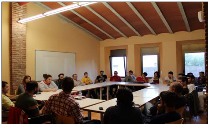
Reunió del Consell Municipal d'Entitats