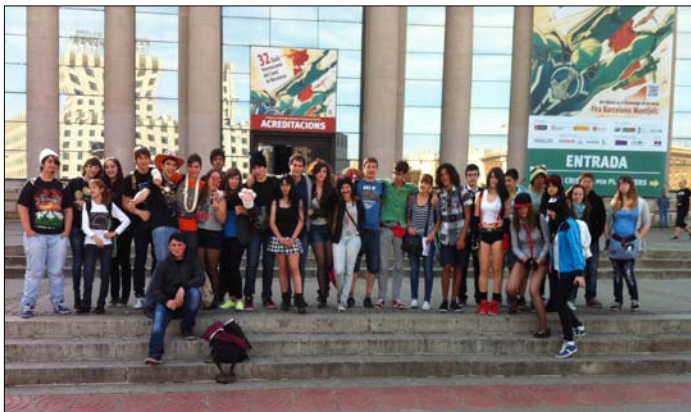
Activitat 13Progrés – visita al Saló del Còmic Juvenils