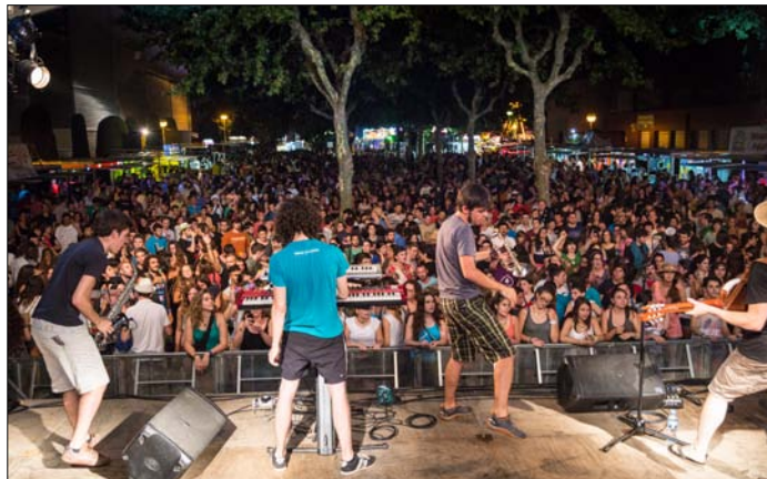
Festa a la Nit - barraques