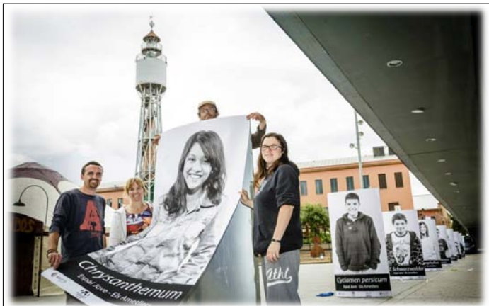
Exposició fotografies Flors i Violes- Espai Jove