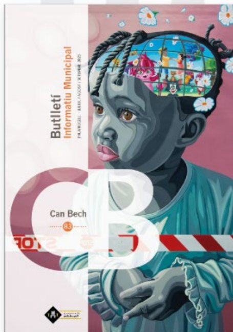
Butlletí Can Bech núm. 83 (juliol-agost-setembre)