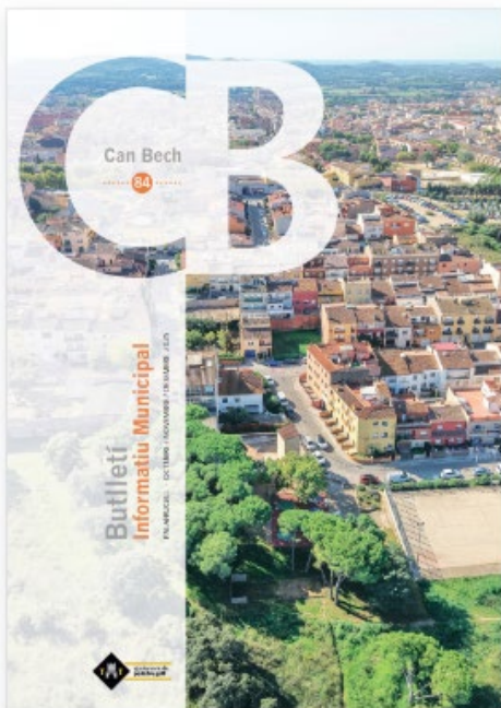
Butlletí Can Bech núm. 84 (octubre-novembre-desembre)