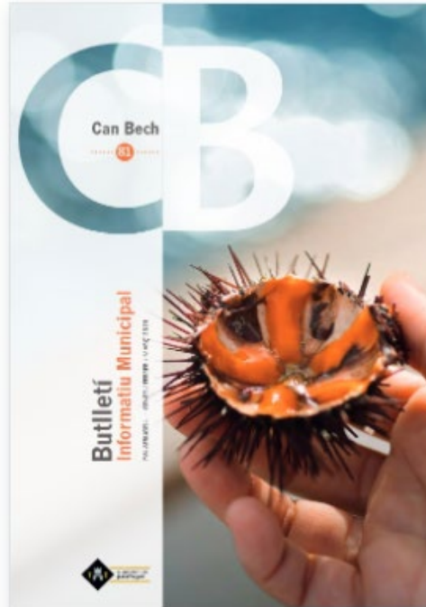
Butlletí Can Bech núm. 81 (gener-febrer-març)