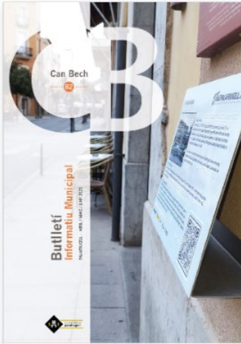
Butlletí Can Bech núm. 82 (abril-maig-juny)