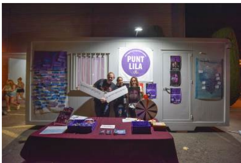
Punt Lila de Palafrugell