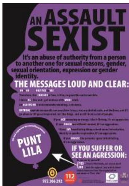
Cartells de sensibilització i informació en català i anglès