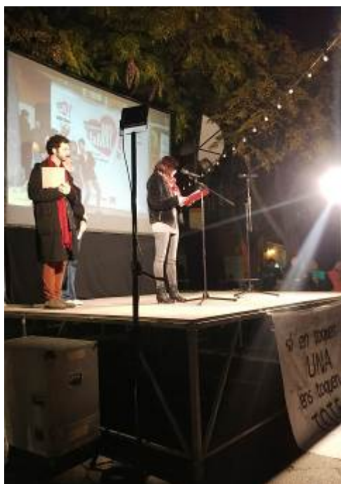
Encesa d'espelmes a Plaça Nova