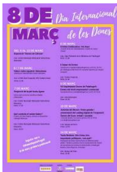
Cartell de difusió del 8M

Els actes entorn el 8 de març es van treballar i coordinar a través de la Comissió d'Igualtat del Consell de Benestar Social que es reuneix 4 vegades l'any per treballar els dies commemoratius, entre d'altres qüestions: