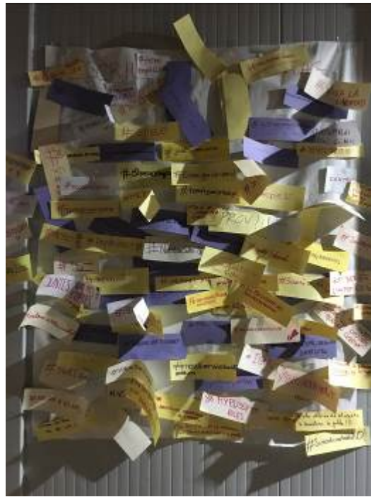
Activitat #escriueu el teu hashtag