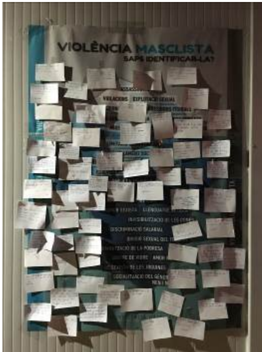
Activitat #jotambé #metoo