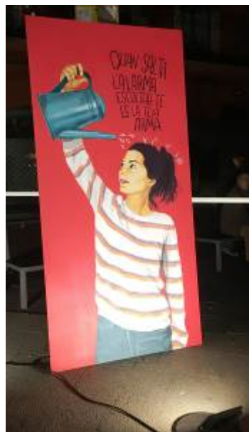
Il·lustració de la Bruna Valls

25 de novembre: Sota el lema “Ballem per unes relacions lliures de violències masclistes” es van organitzar a Plaça Nova i Plaça Ermenganda, una ballada de country i Lindy Hop respectivament. A Plaça Ermenganda també hi havia muntat el photocall d'Estimar No fa mal amb l'objectiu que les persones es fessin una fotografia i escrivissin un missatge en contra de la violència masclista en una pissarra. Les dues activitats van poder organitzar-se amb la col·laboració de la l'Associació Windy Hoppers i l'Associació Europea de Música Country.