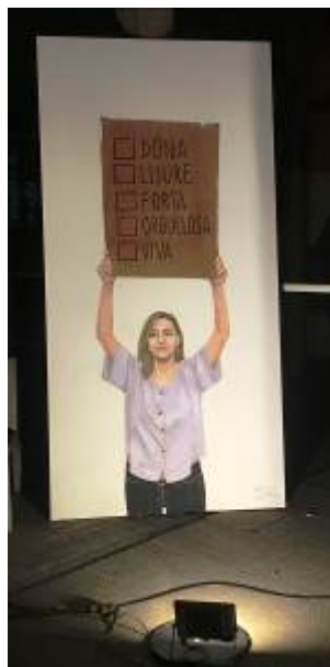
Il·lustració de la Montserrat Abril