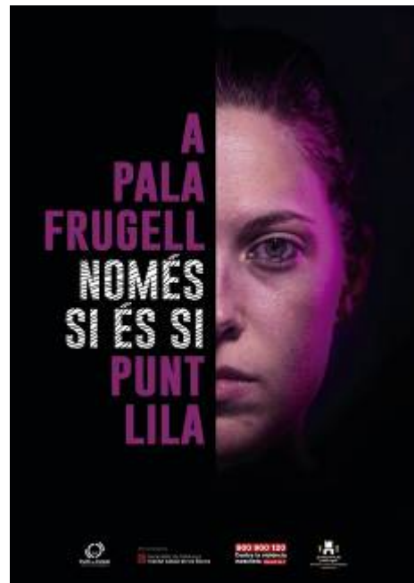
Cartells de sensibilització que es van repartir a l'espai de la festa