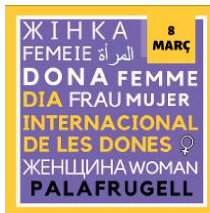
Caràtula del fulletó de difusió