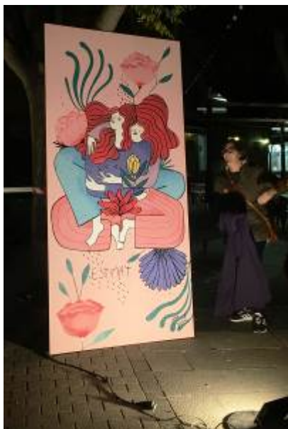
Il·lustració de l'Anna Grimal