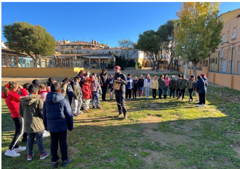
Foto 1. Taller amb escolars a l'escola Josep Barceló i Matas.

Es recomana seguir amb el manteniment i revisió de les caixes d'ocells l'any vinent així com amb els tallers escolars (Foto 1), doncs suposen una experiència molt enriquidora pels alumnes que de ben segur recordaran tota la vida.