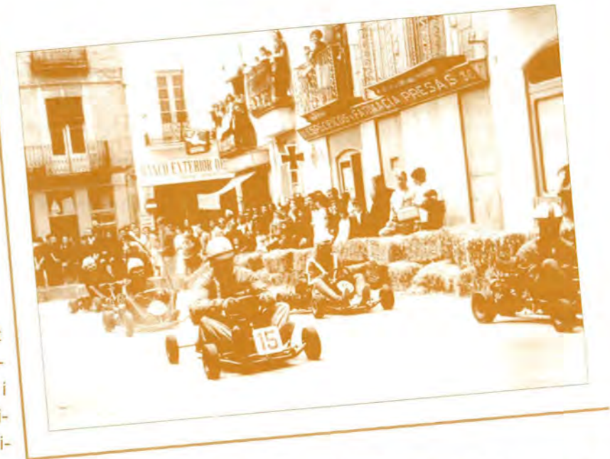
Carnaval de Carnivals, 1997. Les curses de karts eren un dels atractius de les Festes de Primavera dels seixanta

El departament d'Informàtica de l'Ajuntament ha adquirit el programa APCImatge a l'Ajuntament de Girona per tal de poder tractar adequadament les imatges conservades a l'Arxiu -actualment unes deu mil. El programa permetrà consultar directament les imatges en la pantalla de l'ordinador i accedir fàcilment a la seva localització i descripció. Per tal d'escanejar les imatges i introduir les dades l'Arxiu compta amb la col·laboració de Frederic Martí Gich.