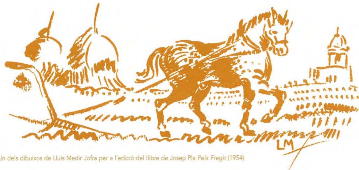
Un dels dibuixos de Lluís Medir Jofra per a l'edició del llibre de Josep Pla Peix Fregit (1954).

Hemeroteca: S'ha completat la col·lecció de la revista Club Vela Calella , gràcies als exemplars cedits per aquesta entitat.