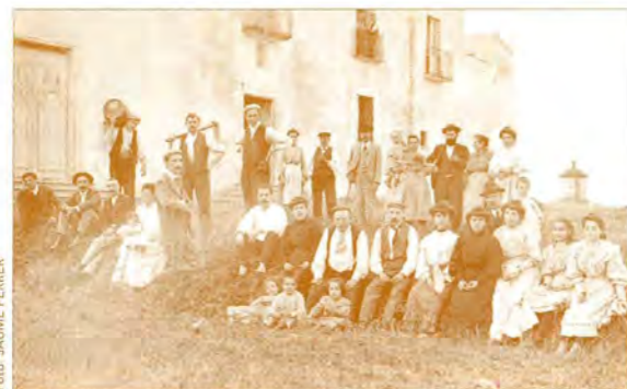
Aquesta imatge d'una família a Sant Sebastià ha estat escollida per a la contraportada de La gent de Palafrugell