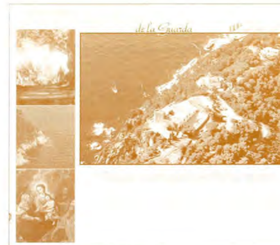
Pàgina inicial de la web de Sant Sebastià

La plana web s'ha estructurat en els apartats següents: presentació del Consell, natura i paisatge, arquitectura i patrimoni, història i tradició, activitats i com arribar-hi.