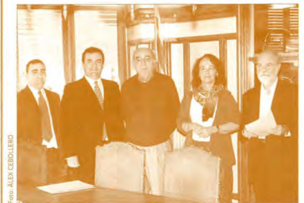
Els representants de l'Ajuntament i de la Societat Genealògica d'Utah van signar el conveni de microfilmació en presència del secretari de la Corporació.

El procés de microfilmació s'ha realitzat a les instal·lacions de l'Arxiu des del 12 de novembre de 2002 al 17 de gener de 2003, i en total s'han obtingut 29.728 fotogrames. Les sèries microfilmades són: padrons d'habitants (1717-1935), censos de població (1857-1897), cèdules personals (1854-1927), quintes, allistaments i lleves (1742-1926), emigració (1887-1917) i registre civil municipal (1838-1927). D'acord amb el conveni signat, s'ha lliurat a l'Arxiu una còpia dels microfilms realitzats, la qual permet millorar les condicions de conservació de les sèries reproduïdes, una documentació única que presenta una elevada demanda de consulta per part dels usuaris de l'Arxiu Municipal.