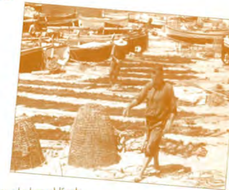
Fotograma de la pel·lícula Marinada (1954), d'Arcadi Gili, projectada el 10 de setembre de 2002 a la plaça de l'Església de Calella per l'Associació de Veïns i Amics de Calella.