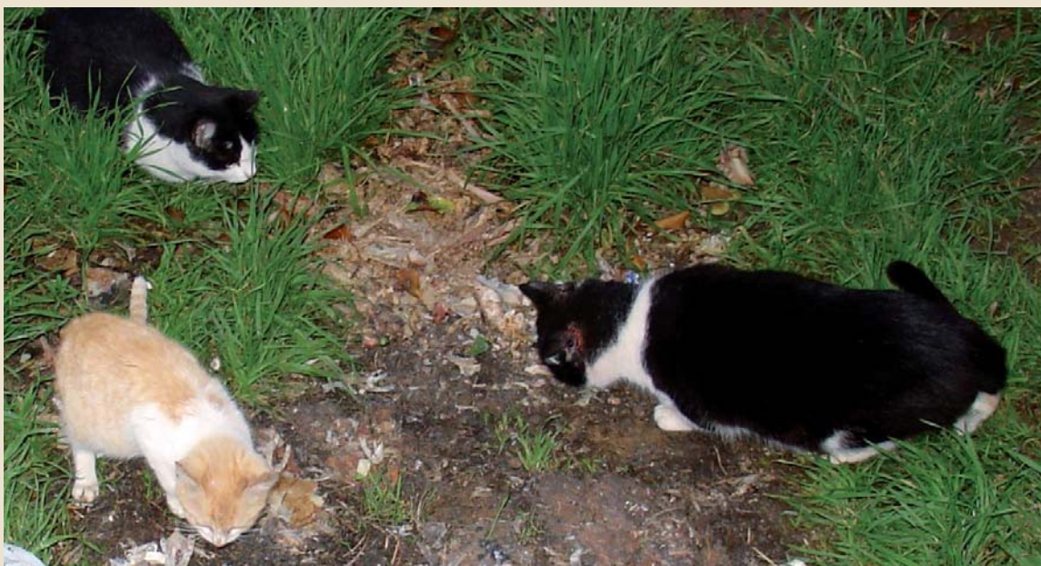
Gats de carrer

Diverses experiències avalen aquest sistema d'intervenció que presenta avantatges, tals com la millora de l'espai públic i la disminució de les baralles en període de zel o la disminució de la natalitat gràcies a l'esterilització.