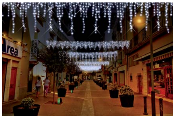
Fotomuntatges de com serà la instal·lació del Carrer Cavallers

Aquest projecte, sumat a diferents iniciatives que s'organitzen per Nadal a Palafrugell, tant de la societat civil com des de la gestió pública, tenen per objectiu reforçar la capitalitat comercial de la nostra vila.