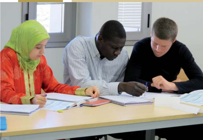
Alumnes del curs de català per a adults

En el proper número us oferirem el programa dels 20 anys, perquè, a més de celebrar els avenços, hem de comprometre'ns amb els reptes que encara ens queden, que són molts.