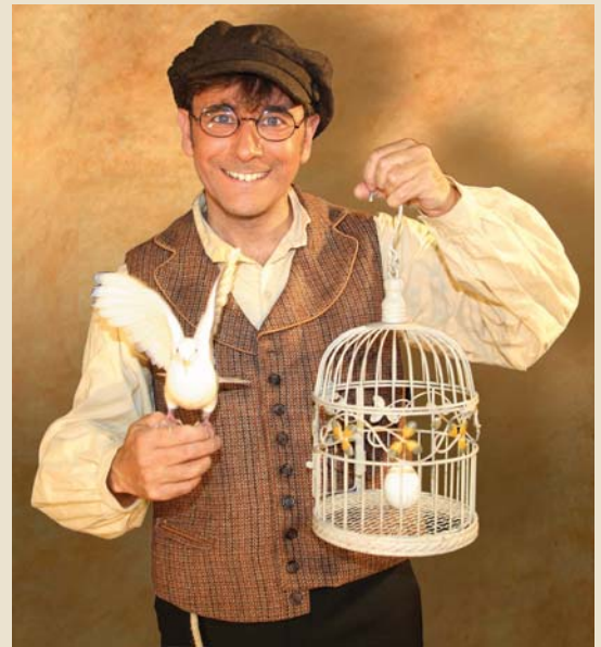
El Mag Enric Magoo a El rodamón

segle d'or espanyol El sentir de mi sentido , a càrrec de la formació Quinta Essència. En ambdós casos s'inicien els concerts amb un prelude musical a càrrec dels alumnes de l'Escola de Música de Palafrugell. Precisament, els professors de l'Escola oferiran el seu concert anual al TMP el pròxim 27 de febrer.